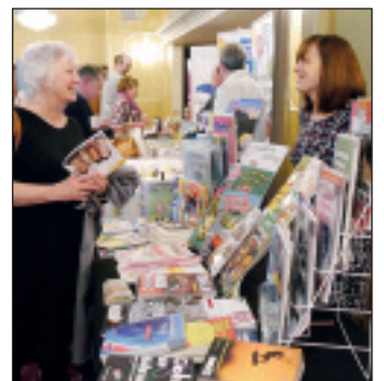
Standin Cyhoeddwr Adnoddau Addysg, Prifysgol Aberystwyth