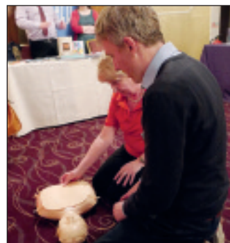
Derbyn cyngor CPR ar stondin British Heart Foundation Cymru

Gellir dysgu mwy am waith Into Film a manteisio ar ei ddarpariaeth drwy fynd i'r wefan www.intofilm.org neu drwy anfon e-bost at cardiff@intofilm.org